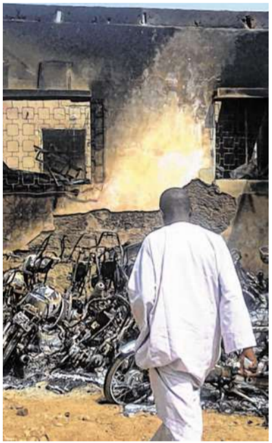
Islamisten erklären den Krieg: Eine Polizeistation in Kano ist völlig zerstört worden. In einem Vorort der Stadt soll gestern ein deutscher Ingenieur entführt worden sein.

Aachen. Der Tod ist in Nigeria allgegenwärtig. 253 Menschen sterben alleine im Januar bei Anschlägen. Tagtäglich erschüttern Bombenexplosionen den mehrheitlich von Muslimen bevölkerten Norden des Landes. Unvergessen sind auch in Deutschland die Bilder vom zweiten Weihnachtstag: Bei einer Explosion während des Gottesdienstes verlieren 35 Menschen in einer Kirche nahe Abuja ihr Leben. Warum nur?