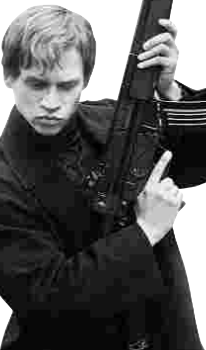
Vinzenz Kiefer im RAF-Film „Baader-Meinhof-Komplex“.

Daneben hat sich Aust im Laufe der Jahre einen Ruf als Züchter exzellenter Springpferde gemacht: 1974 erstand er sein erstes Zuchtpferd. 2007 verkaufte er dessen Nachfahren für stolze 400 000 Euro. Außerdem sitzt er im Beirat des Aachener CHIO, bei dem er regelmäßig zu Gast ist. (mar)